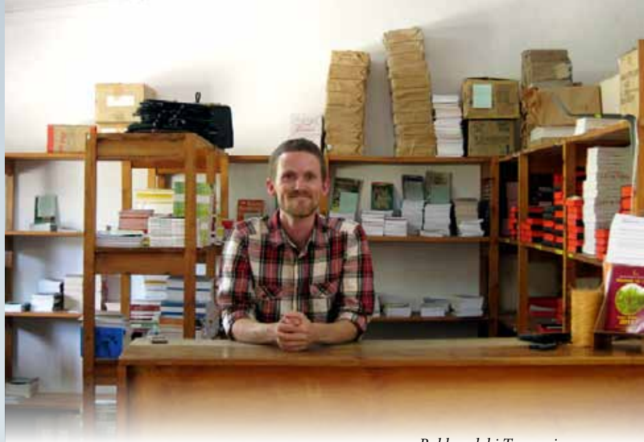
Bokhandel i Tanzania

Så blomestrø i ei potte saman med fadderbarnet, sjå at dei spirer og gror, utfrå dette kan du fortelja om åndeleg liv og vekst.