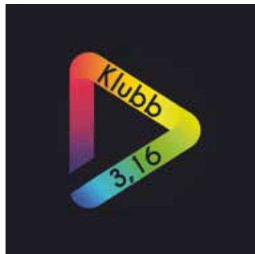
ILLUSTRASJON: ANDREAS KASLEGARD

Hausten 2017 starta ein gjeng med ungdommar med nokre engasjerte vaksne i ryggen Klubb 3.16. Ungdommane ville ha ein stad der dei kunne vere seg sjølv. Ein fristad og ein stad å bygge gode relasjonar.