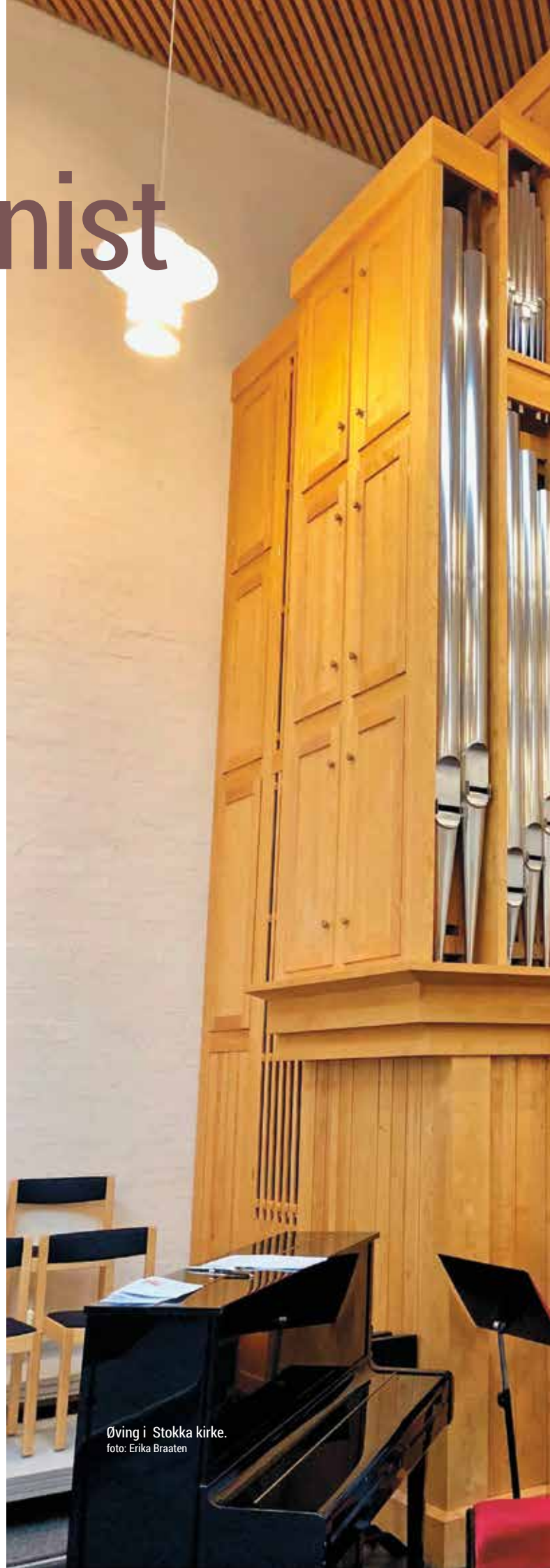
Øving i Stokka kirke.

Et av delmålene til PIO er å bidra til rekrutting til utdanning og yrkesliv som kirkemusiker i Den norske kirke. Dette passer Solveig godt. Siden hun var liten har hun trivdes godt i kirken, og har lenge hatt lyst til å utdanne seg til et yrke med kirken som