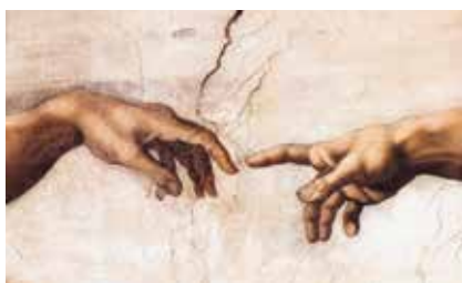
MALERI: Michelangelo – Skapelsen 1508–1512 (detalj)