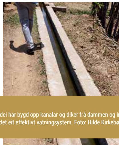
Roda viser korleis dei har bygd opp kanalar og diker frå dammen og inn i parsellane. På den måten blir det eit effektivt vatningsystem.

mikrolån. Låna må bli godkjent av resten av gruppa. Ved hjelp av låne- og sparegruppen og med veiledning har landsbyen bygd opp ein organisk hage. Kvar familie har sitt eige område der dei bl.a. dyrkar lauk, kål, paprika, tomat, mais, korn, bønner. Dei har også husdyr som høner, kylling, geit og kyr. Maisen kan dei steike, koke og male opp til mjøl. Den blir også brukt som kraftfôr til dyr.