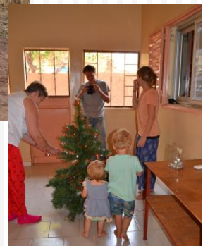
Juletreet vi arvet av noen amerikanske misjonærer er herved innviet