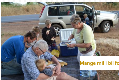
Mange mil i bil for å komme oss hit vi bor

Vi har hatt en veldig gledelig jul med veldig gledelig besøk av alle fire foreldrene våre. Jula har inneholdt både pinnekjøtt og et juletre med blinkende røde lys, et ukjent antall marsipangriser, freia melkesjokolader og brunost. Så vi har kooost oss!