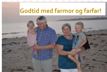
Godtid med farmor og farfar!