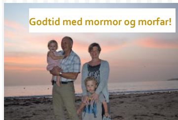
Godtid med mormor og morfar!