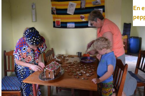
En etter hvert ganske folksom pepperkakehusbygging i landsbyen