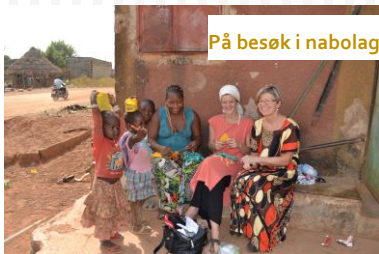
På besøk i nabolaget