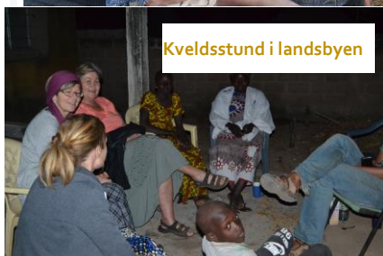
Kveldsstund i landsbyen