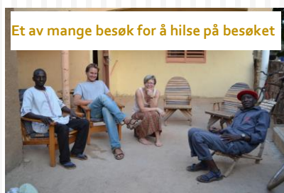
Et av mange besøk for å hilse på besøket